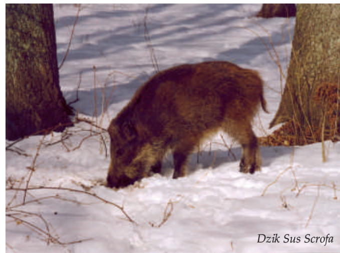
Dzik Sus Scrofa

Powierzchnia rezerwatu wynosi 7,00 ha, jego teren obejmuje faliste pole wydmowe, którego zagłębienia zajmują siedliska bagienne. Rezerwat leży w pasie obniżonego terenu