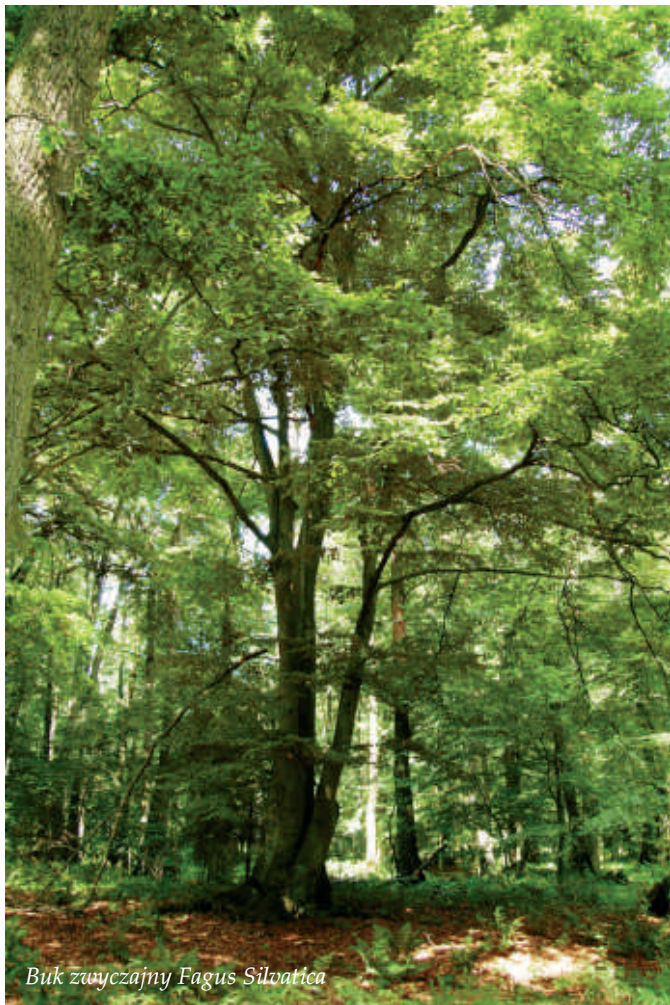
Buk zwyczajny Fagus Sylvatica