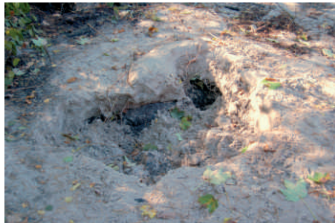
Ślady nielegalnego wydobycia bursztynu