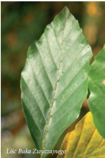
Liść Buki Zwyczajnego