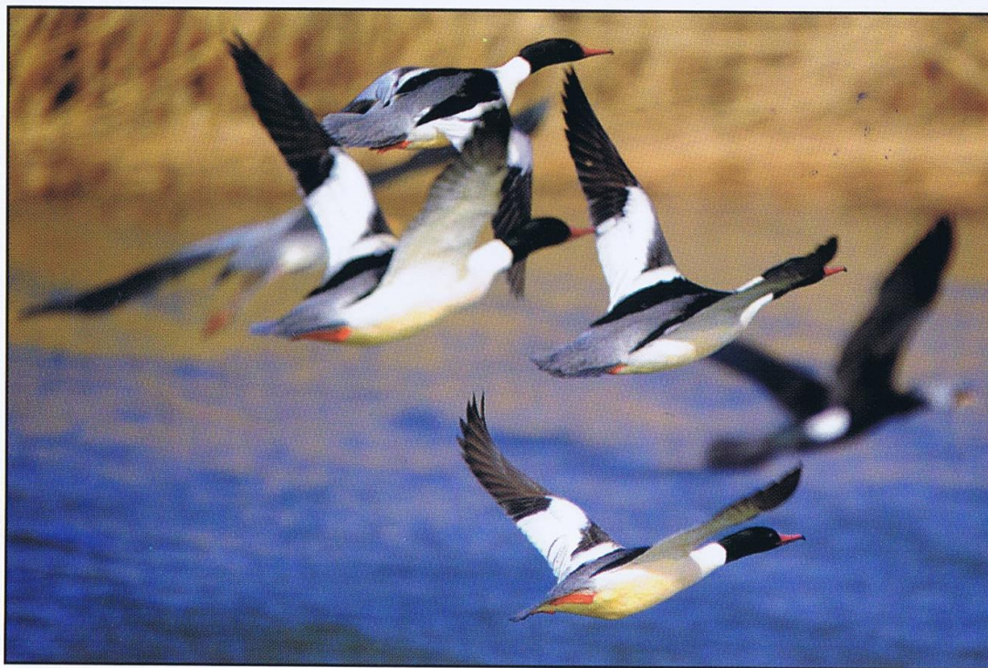
Tracze nurogęsi ( Mergus merganser )

W końcu lutego w naszych szerokościach i długościach geograficznych nastął ruch w ptasim świecie i zaczęły się intensywne migracje. Ptaki, które spędziły u nas zimę ruszyły na swoje stanowiska lęgowe. Odleciały zimujące łodówki, uhle i jemiołuszki. Na przełomie lutego i marca na żuławskich polach pojawiły stada gęsi zbożowych i białoczelnych. Marzec i kwiecień to czas kiedy ptaki przelotne oblegają tereny naszego Parku i otuliny oraz ich najbliższe okolice. Ptasie „korytarze powietrzne” – przebiegają nad Mierzeją Wiślana wzdłuż i wszerz. Dziesiątki tysięcy gęsi oraz kaczek znajdują tu od wieków doskonałe warunki