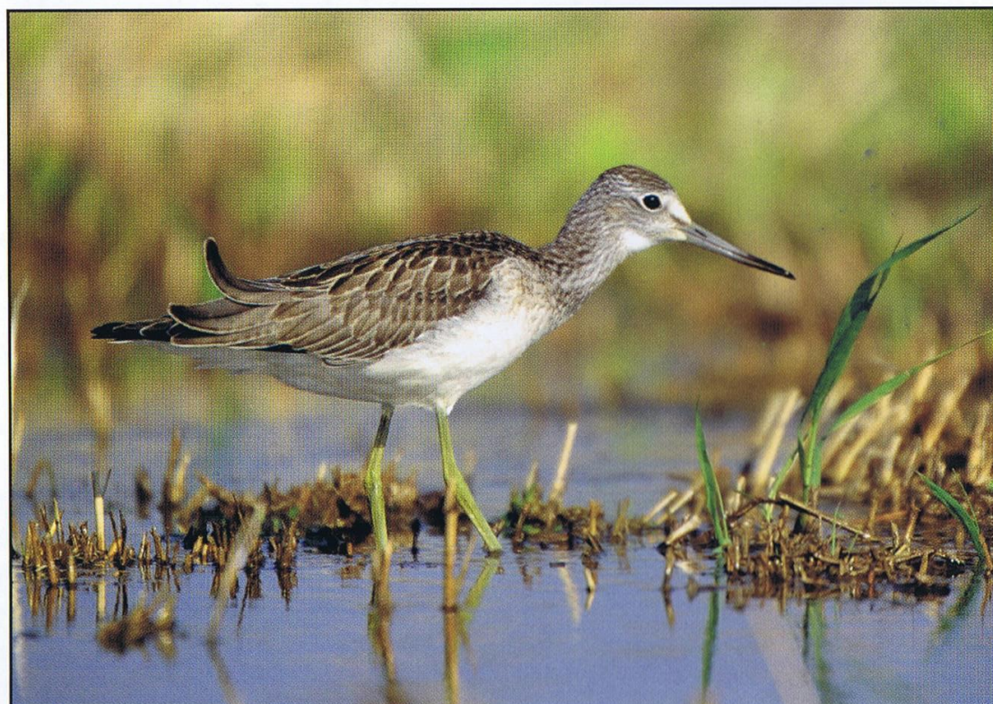
Kwokacz (Tringa nebularia)