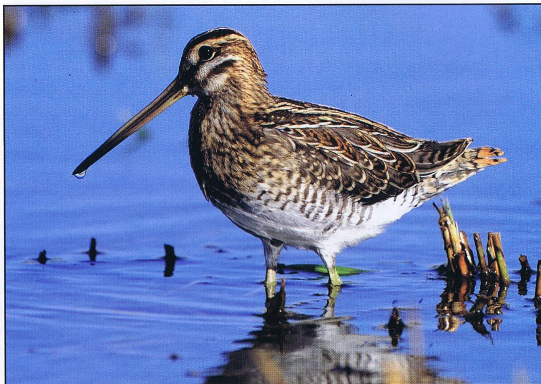
Kszyk (Gallinago gallinago)