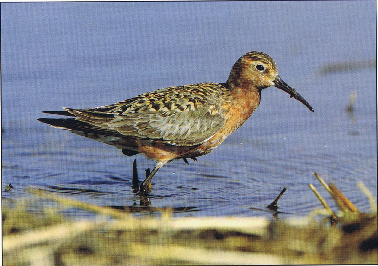
Biegus krzywodzioby ( Calidris ferruginea )

stawicieli siewkowatych: siewka złota ( Pluvialis apricaria ), kulik wielki ( Numenius arquata ) i mniejszy ( Numenius phaeopus ), bekasik ( Lymnocyptes minimus ), rycyk ( Limosa limosa ), kszczyk ( Gallinago gallinago ), kwokacz ( Tringa nebularia ), samotnik ( Tringa ochropus ), łączak ( Tringa glareola ), krwawodziób ( Tringa totanus ), brodziec śniady ( Tringa erythropus ), batalion ( Philomachus pugnax ), biegus zmienny ( Calidris alpina ), biegus krzywodzioby ( Calidris ferruginea ) oraz biegus malutki ( Calidris minuta ) oraz bardzo liczne czajki ( Vanellus vanellus ).